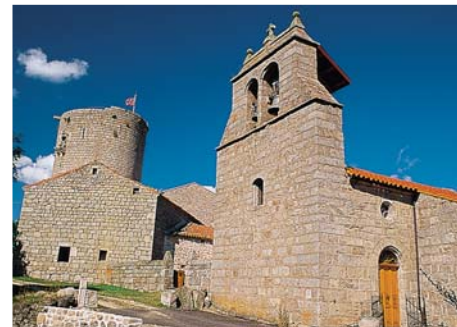
Esplantas : le clocher-peigne et le donjon du 13 e siècle.

plateau de Saugues et Esplantas ) et continuer sur la route. 6 À la fourche, descendre à droite. Traverser la Virlange. Suivre la piste. À la fourche qui suit, monter sur le chemin de gauche. Au croisement suivant, prendre à droite. Continuer sur le sentier entre pâturages et sapinières jusqu'à une route. 7 La suivre jusqu'à la D 32 et emprunter celle-ci à gauche sur 50 m. 8 Descendre la route à droite. Franchir la Virlange et remonter sur la piste jusqu'à Freycenet ( métier à ferrier ). Traverser le village en montant sur la gauche. 9 Couper la D 32 et continuer sur la piste à droite ( vue sur le plateau du Gévaudan ). Plus loin, virer sur un chemin herbeux à droite. Rejoindre la D 32 et la descendre sur la gauche ( vue sur Saugues ). 10 S'engager sur la petite route de gauche qui rejoint Saugues.